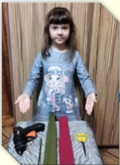
Готовим материал для работы