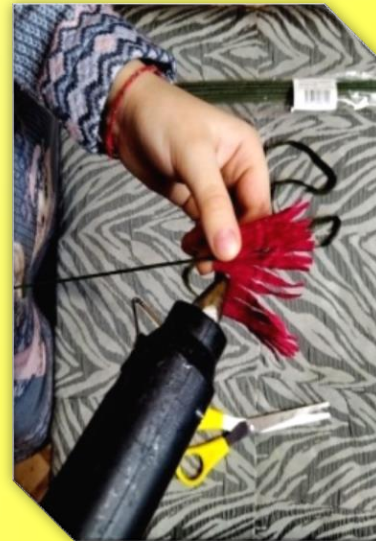
Крепим заготовку к проволоке