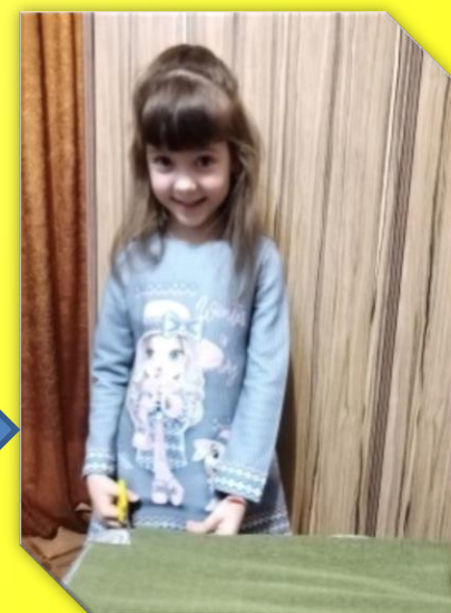
Вырезаем квадраты 4 на 5см