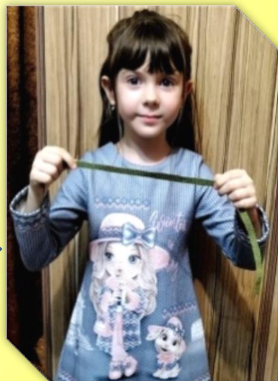
Полоска зеленого цвета, шириной 1см и длиной 15см