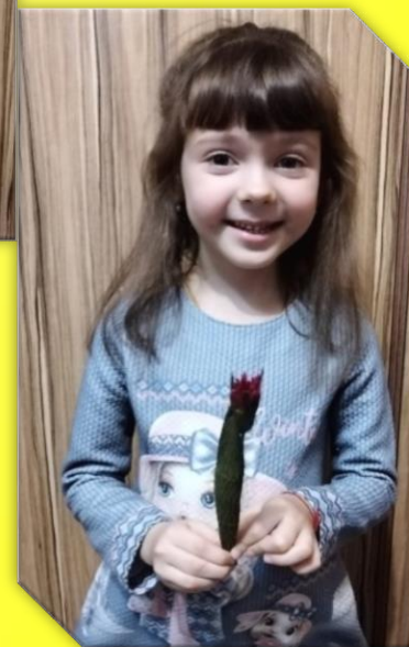
Приклеиваем с внизу к стеблю