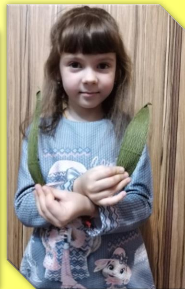
Вырезаем большие листья