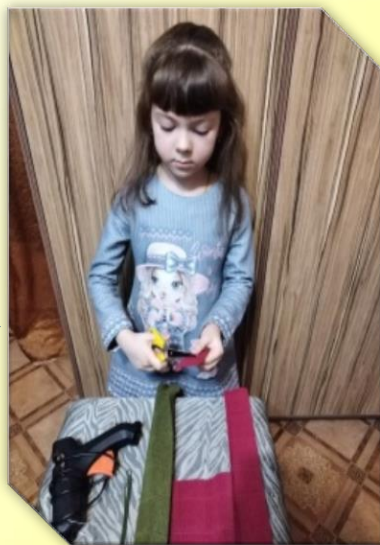
Вырезаем заготовку для бутона