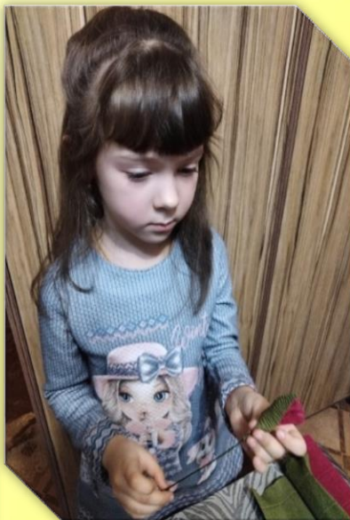
Приклеиваем лепесток к бутону